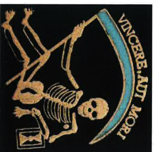
Devisen på de Bellinggska husarernas mössa