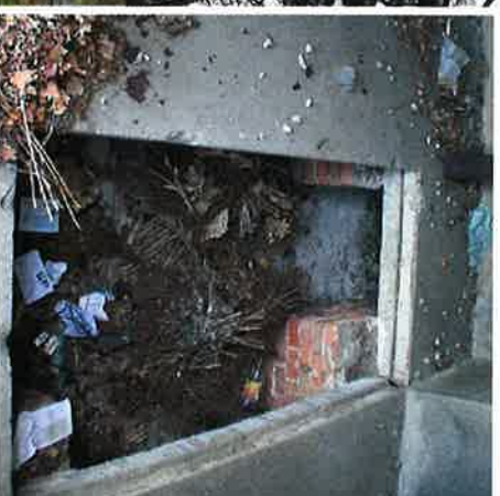
"Graven var tom"