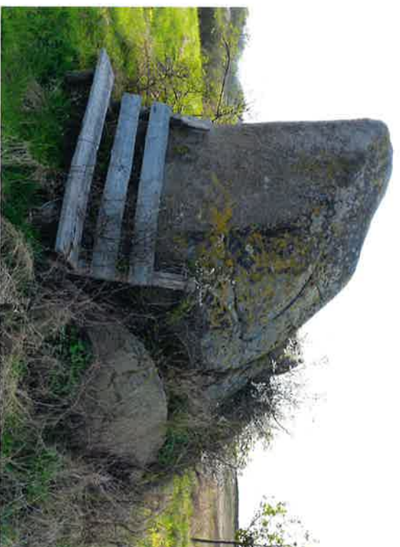
Blücherstenen vid Kavelpass platsen där Geberhard tillfångatogs

Fred slöts i Tilsit 1807 varvid Geberhard blev militär guvernör i de Tyska delarna av Pommern. När kriget mot Napoleon bröt ut 1813 var den då 70 årige Gebhard åter på slagfältet, "alter vorwärts" eller "Marshall vorwärts" var hans smeknamn (gamle framåt eller marskalk framåt). Tillsammans med generalstabsschefen Gneisenau kom han att kröna sin krigsmannabana och han spelade en avgörande roll under slaget vid Waterloo.