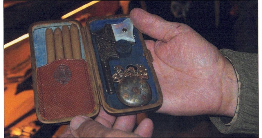
Ingen pistol vid spelbordet var en gyllene regel!! Men en god cigarr och en klocka var inte förbjudet. Sen att det fanns plats för en liten pistol kunde ju ingen veta.