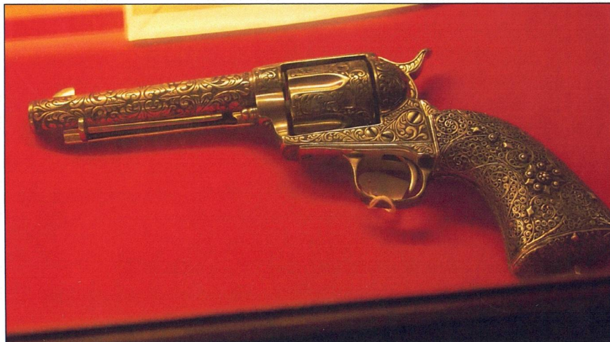
Saddams revolver som på krokiga vägar via en amerikansk officer hamnade i Danmark!