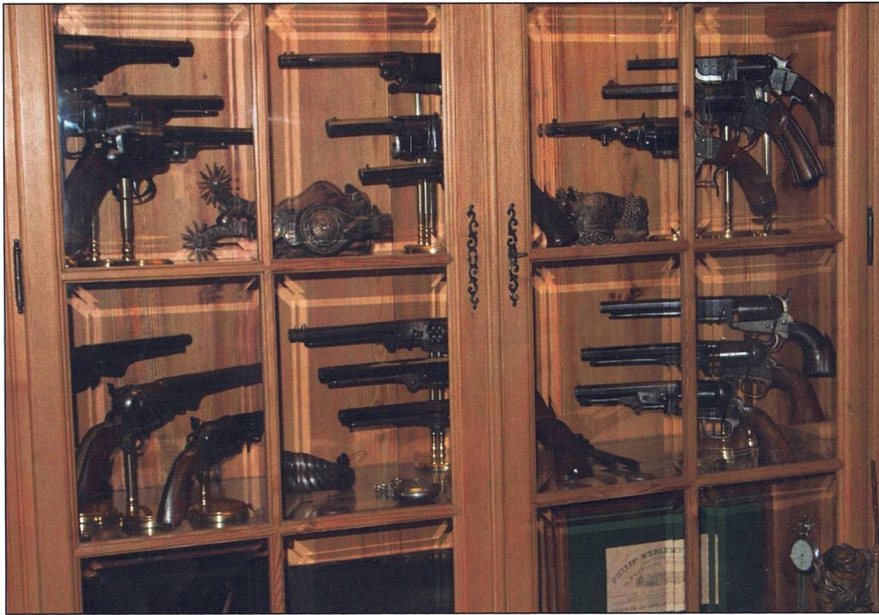
En prydlig samling Revolvrar