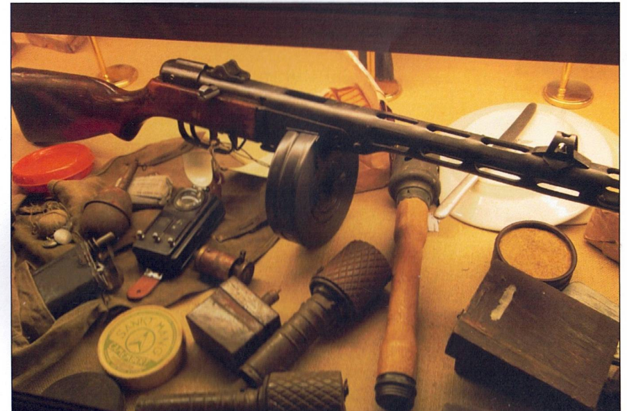
En monter med det viktigaste i kampen mot tyskarna. Vapen, handgranater, trampminor och övrigt "matnyttigt".