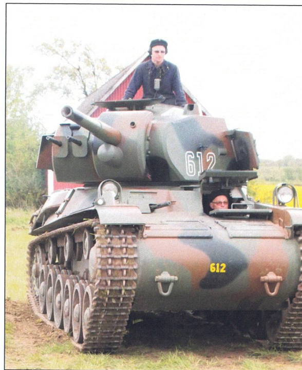
Stridsvagn M/42. Från sommarens uppvisning på beredskapsmuseet i Helsingborg.