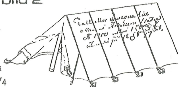
Bild 2 Modellritning till manskapstält